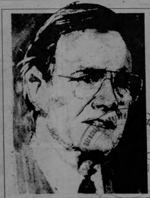
Incremento de "ayuda" militar a Centroamérica puede convertirse en una de las guías de acción de Bush, nuevo presidente norteamericano.

Guatemala continúa sus esfuerzos por sostener el gallardete de abanderado de la paz regional, mientras el Gobierno de Vinicio Cerezo se debate en un espacio político cada vez más es-