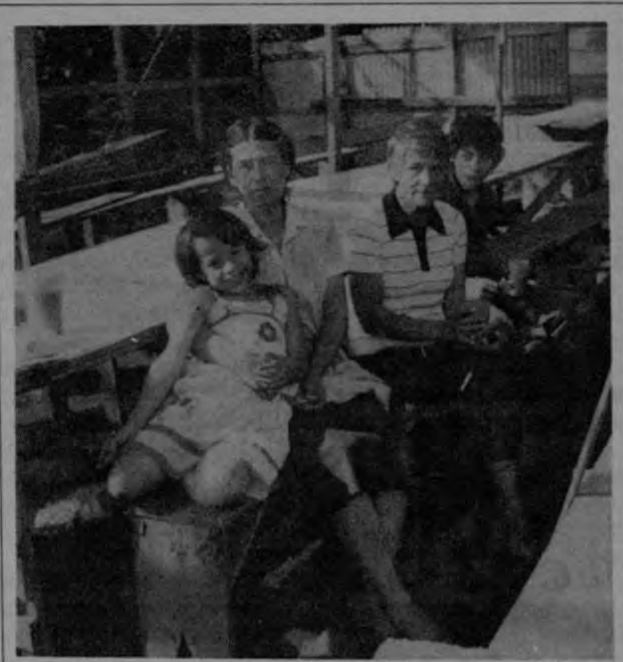
Con el trabajo de hombres, mujeres y niños la nueva urbanización se construye con rapidez.

En base a los planes realizados, desde el mismo viernes 11 de noviembre los vecinos procedieron a construir sus viviendas. Para llevar adelante la obra han recurrido a los fondos de la Asociación de Desarrollo y sus ahorros personales.