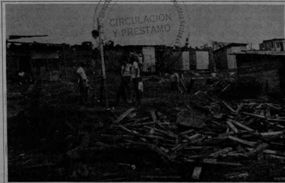
Durante dos años los vecinos han invertido $2.7 millones en mejoras al terreno.