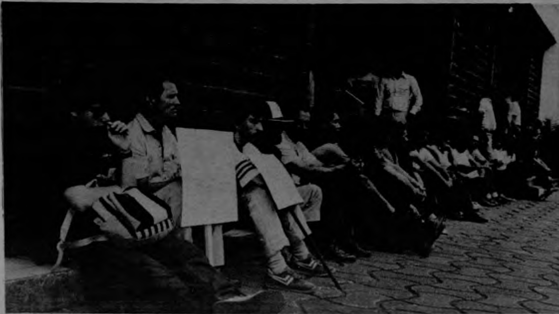
La Universidad de Costa Rica y las otras tres instituciones de educación superior decretaron paros nacionales para el miércoles 16 y viernes 18, y una asamblea nacional conjunta que se verificará el martes 22 próximo.

Con dos paros nacionales universitarios, los empleados de la educación superior mostraron su rechazo al acuerdo suscrito por el gobierno y los rectores de las cuatro universidades públicas.