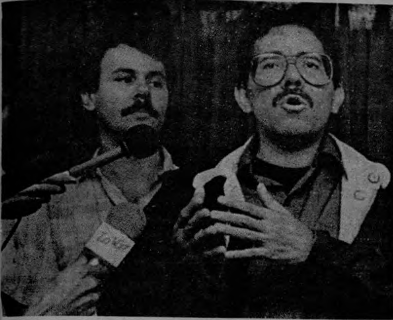
El presidente nicaragüense Daniel Ortega urgió a sus colegas centroamericanos a buscar vías que reactiven el proceso de paz.

intentos de llevar a un atolladero el arreglo político en la región. Ahora la Casa Blanca se esfuerza por frustrar la cumbre centroamericana programada para finales de este mes, llamada a impulsar la puesta en práctica de los acuerdos guatemaltecos. Señaló el dirigente nicara-