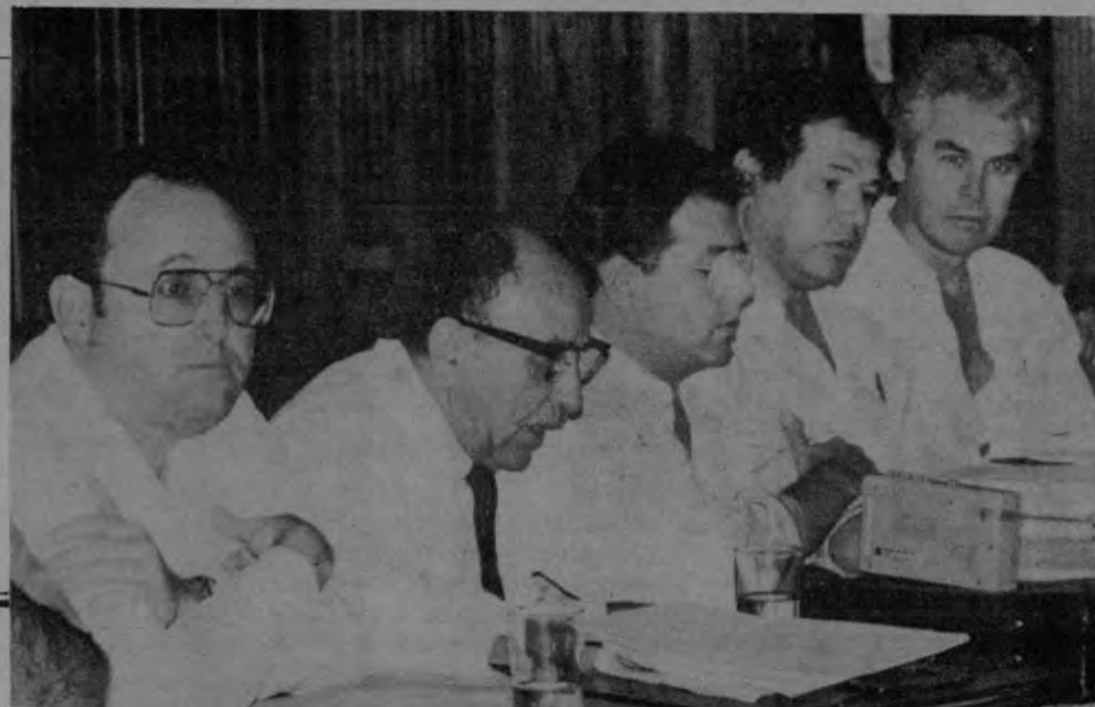
La tesis de la concertación social ha sido tema de interés del sector empresarial, como lo manifestaron sus dirigentes en los encuentros de 1986. Hoy, dos dirigentes sindicales hacen suya esa tesis.

Rojas agregó que han sido el movimiento sindical y el movimiento campesino las fuerzas beligerantes en contra de la política económica y social del Gobierno y de los atropellos que comete a diario el sector patronal, y una alternativa de concertación, lo que podría provo-