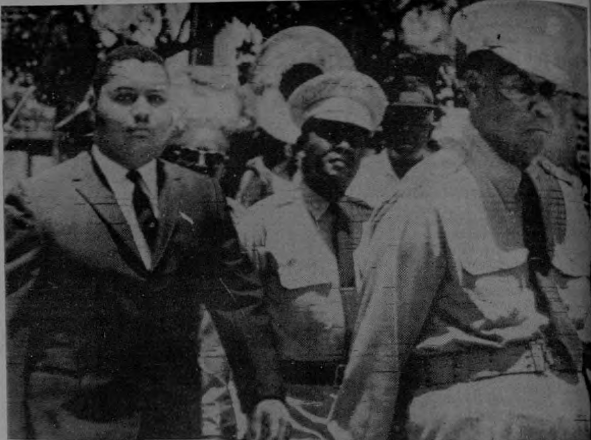
El depuesto régimen de Duvalier (izquierda) dejó como herencia un aparato represivo, cuyo poder empieza a resquebrajarse como producto de la lucha del pueblo haitiano.

El objetivo que mueve el movimiento de los sargentos no es la lucha contra el narcotráfico, sino la vuelta a la constitucionalidad de 1987, el castigo a los criminales duvalieristas, la reestructuración del ejército, la lucha contra la corrupción y la vuelta a un régimen de derechos civiles, a través del cual el país puede encontrar el camino de la democracia, que tanto ha buscado en estos dos últimos años.