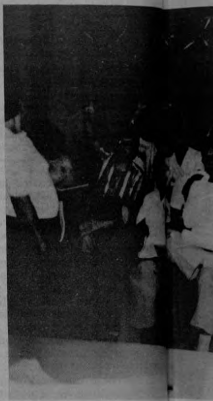
Un aspecto de los plenarios.

Desarrollar un partido moderno, eficiente y democrático, como se estableció en el lema de la Asamblea, constituyó la preocupación fundamental de los comunistas de San José reunidos en la Asamblea Regional efectuada el pasado fin de semana y que se dedicó a la memoria del insigne educador costarricense Omar Dengo.