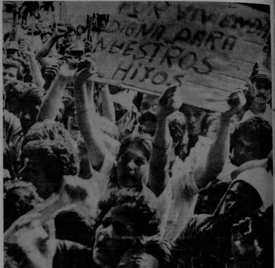
La revolución popular debe brindar a las masas no sólo conquistas sociales y económicas sino un régimen de amplia participación democrática.

Kautsky, poco antes de su muerte, en 1938, haciendo una recapitulación de sus críticas a la revolución rusa, expresó que en cuanto a su pronóstico de que esa revolución no podría sostenerse durante mucho tiempo, se había equivocado de cabo a rabo, pero que en cuanto a su afirmación de que allí había u-